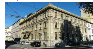
UNIVERSITA DEGLI STUDI DI MILANO, Italia www.unimi.it