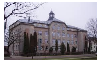
Bauskas Valsts gimnazija Bauska, Letonia www.bauskasvg.lv

Proiect finanțat de Comisia Europeană prin Programul Erasmus+. Acest material reflectă doar opinia autorilor și nu reprezintă în mod necesar poziția oficială a AN sau a Comisiei Europene.