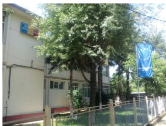
Liceul Tehnologic PETROL Moreni, Romania http://gsip.xhost.ro