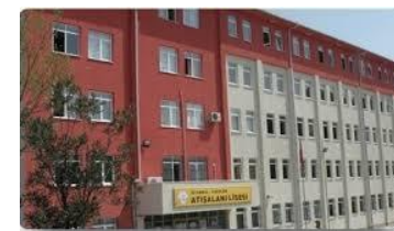
Atısalanı Anadolu Lisesi Istanbul – Turcia http://mebk12.meb.gov.tr/meb_iys_dosyalar/ 34/33/307747/index.html