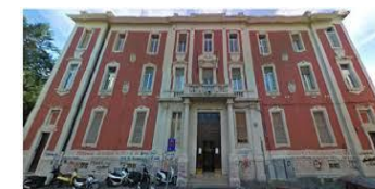
Convitto Nazionale Domenico Cirillo - Scuole Annesse Bari, Italia http://www.convittocirillo.it/