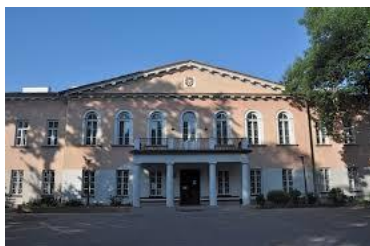
VI Liceum Ogólnokształcące im. Króla Zygmunta Augusta w Białymstoku, Białystok, Polonia www.vilo.bialystok.pl